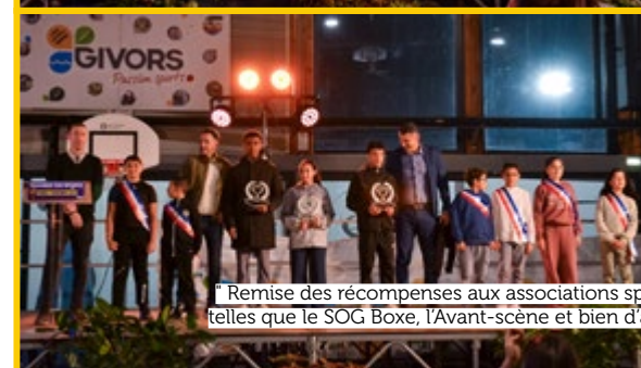
" Remise des récompenses aux associations sportives telles que le SOG Boxe, l'Avant-scène et bien d'autres. "