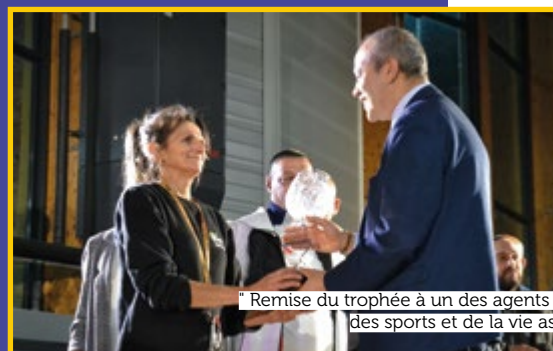
" Remise du trophée à un des agents du service des sports et de la vie associative "