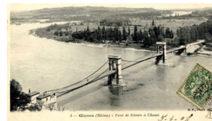
" Vue panoramique du pont suspendu sur le Rhône dans les années 1900 © B. F. Paris. "

Plus qu'un simple ouvrage d'art, le pont de Chasse, qui relie Givors et Chasse-sur-Rhône au-dessus du Rhône, symbolise le lien entre deux territoires voisins et l'ingéniosité des ingénieurs du XIX e siècle. Œuvre des ingénieurs Rolland et Ravel et Garella, il fut réalisé entre 1835 et 1837 selon la technique innovante des ponts suspendus des frères Seguin. D'abord voulu pour remplacer le bac à traile, le projet connut de nombreuses difficultés avant son achèvement. Son emplacement fit débat : les habitants de Givors furent consultés en juin 1834 et se prononcèrent majoritairement pour un déplacement du pont vers l'aval, près du port de Bief. Malgré les réserves des ingénieurs, leur avis fut retenu et le chantier put commencer contre un droit de péage, qui fut aboli en mars 1887 et donna lieu à une grande fête publique . Le 3 juin 1836, lors d'un essai, le pont s'effondra, causant la mort de quatre personnes. Reconstruit et inauguré le 1 er janvier 1837 , il devint un passage essentiel entre les deux départements. À la fin du XIX e siècle, d'importants travaux furent menés par l'ingénieur Arnodin. Aujourd'hui encore, le pont de Chasse demeure un repère pour les habitants, témoin de l'histoire industrielle et humaine de la vallée du Rhône. En traversant le pont, chacun foule un peu de notre histoire commune : celle d'un lien suspendu entre deux rives et deux siècles.