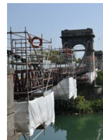
" Vue du pont de Chasse pendant les travaux de consolidation – août 2025 © service communication de la ville de Givors. "