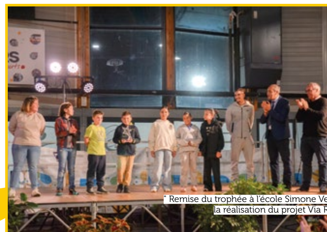
" Remise du trophée à l'école Simone Veil pour la réalisation du projet Via Rhôna "